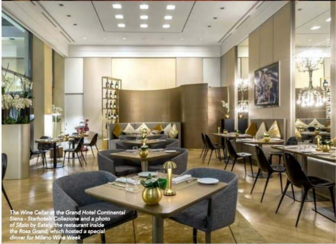
The Wine Cellar at the Grand Hotel Continental Siena - Starhotels Collezione and a photo of Sfizio by Eataly, the restaurant inside the Rosa Grand, which hosted a special dinner for Milano Wine Week