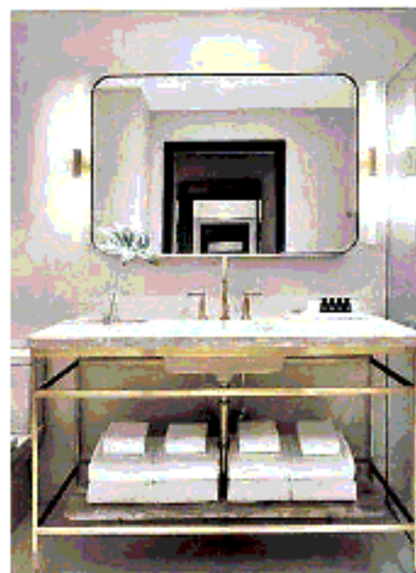
I. FERRI La paradosica della stanza di Isabella a Gallia