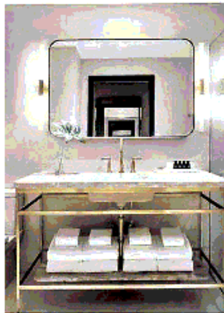
1. 1990: le particolarità della stanza del letto a Galles