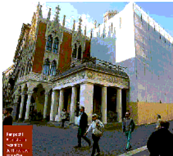
Il progetto L'idea di un hotel di lusso a Padova, in un edificio storico, è stata presentata dalla I-cle Group. Il progetto prevede 25 posti letto, stanze con dedica ai personaggi storici della città.