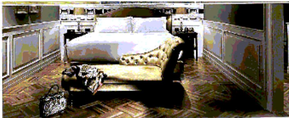
Il nuovo hotel nel centro storico con i tralci suvati in stile vittoriano

► Tralci suvati dedicate a personaggi famosi come Garibaldi, Nieuvo e Giotto ► Il Comune ha restaurato le facciate mentre F&De Group allestirà gli interni